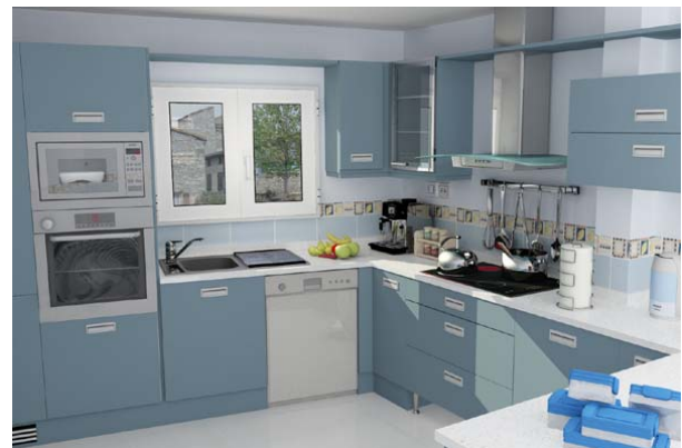
DISEÑO DE COCINAS