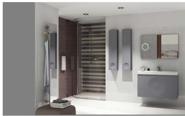
DISEÑO DE BAÑOS