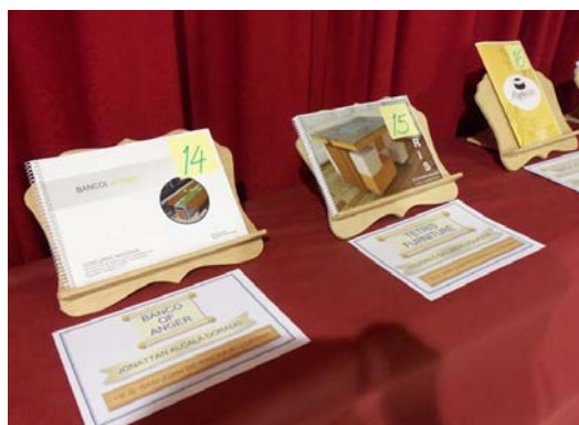
Detalle de presentación de cada proyecto en la exposición